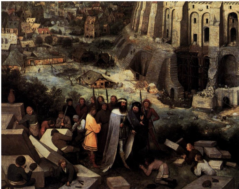
Bruegel, The Tower of Babel [Detail]

(ח) ויפץ ה' אתם וגו' ויחדלו לבנות העיר. ולא כתיב המגדל דאפי' היה נבנה המגדל היה בטל תכליתו להשגיח על הנבדל מהם. אחרי אשר נתבלבלו בלשונם. ולא ידעו אחד דברי רעהו אבל עדיין היה אפשר להסכים ברצון אחד לשבת יחד משי"ה הודיע הכתוב שממילא נפרדו לגמרי: